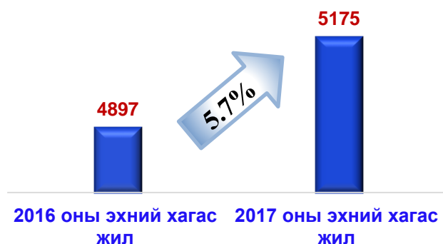
Нийт хүлээн авсан санал, өргөдөл, гомдол

Нийт хүлээн авсан санал, өргөдөл, гомдлын 31 буюу 0.6 хувь нь санал, 5068 буюу 97.9 хувь нь өргөдөл, 76 буюу 1.5 хувь нь гомдол байна.