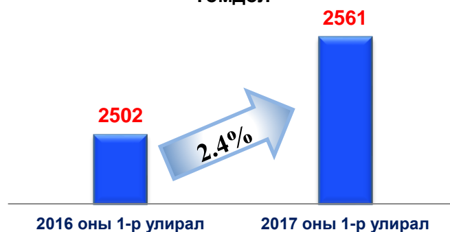
Нийт хүлээн авсан санал, өргөдөл, гомдол

Нийт хүлээн авсан санал, өргөдөл, гомдлын 23 буюу 0.9 хувь нь санал, 2507 буюу 97.9 хувь нь өргөдөл, 31 буюу 1.2 хувь нь гомдол